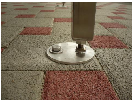
Variante I: unsichtbares Fundament

Zur sicheren Bodenbefestigung benötigen Sie vier Punktfundamente. Diese Fundamente können Sie selbst mit Fertigbeton aus dem Baumarkt oder z.B. mit Hilfe eines Garten- u. Landschaftsbauers anfertigen. Folgende Fundamentformen sind möglich (bitte Variante bei Bestellung angeben):