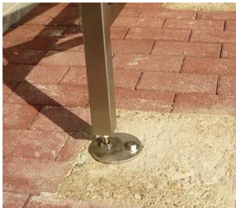
Variante II: sichtbares Fundament

Fundament befindet sich direkt unter der Pflasterung. Zwischen Pflastersteinen oder Bodenplatten und Fundament sollte sich möglichst kein Schotter, Kies etc. befinden. Die Steine sind dann im direkten Kontakt mit dem Betonfundament. Die Fundamente sind optisch nicht sichtbar.